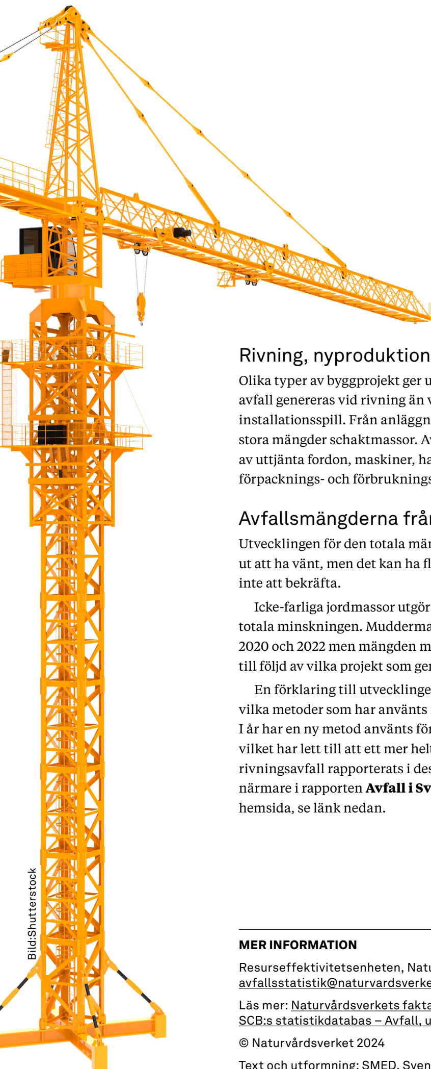
Trend byggbranschen, icke-farligt avfall ton